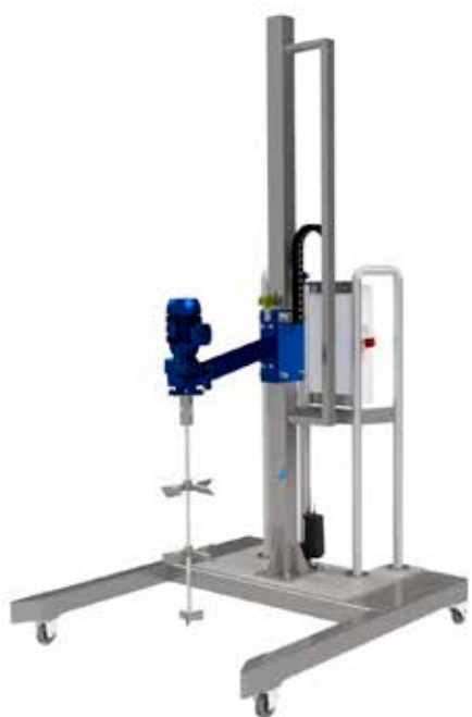
Transportabel mixestation for IBC palletanke

Udover de her viste standardmixere, byder vi også på kraftigere udgaver for tykkere konsistenser, ved hurtig bundfældning, ATEX, føde- og drikkevareproduktion, pharma, aggressiv kemi (plast), specialtanke m.m. Skal der mixes kontinuerligt og med hurtige skift mellem standard transporttanke, såvel palletanke som tromler, anbefaler vi vores mixerstationer. Vi står klar til at gennemgå enhver mixeropgave med jer.