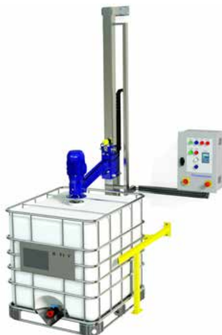
Stationær mixestation for IBC palletanke